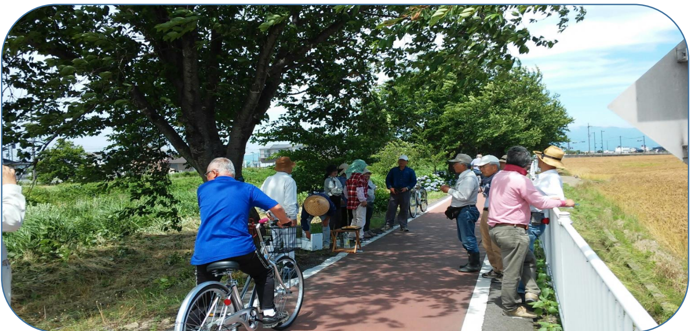
作業終了後参加者でおやつを食べながら休憩