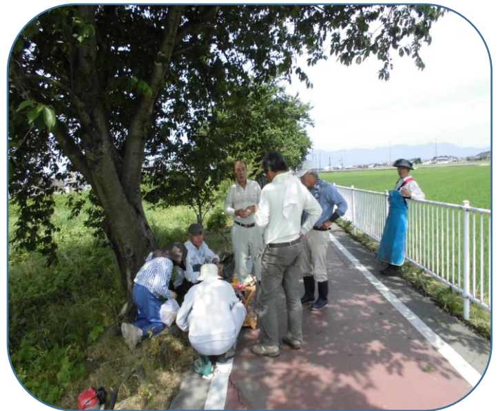
日陰で水分補給と休憩