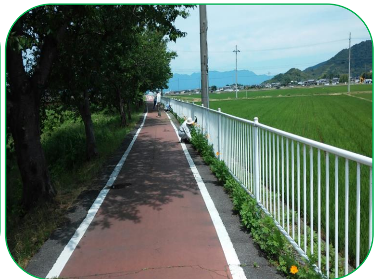
コスモス・ひまわり周りの除草