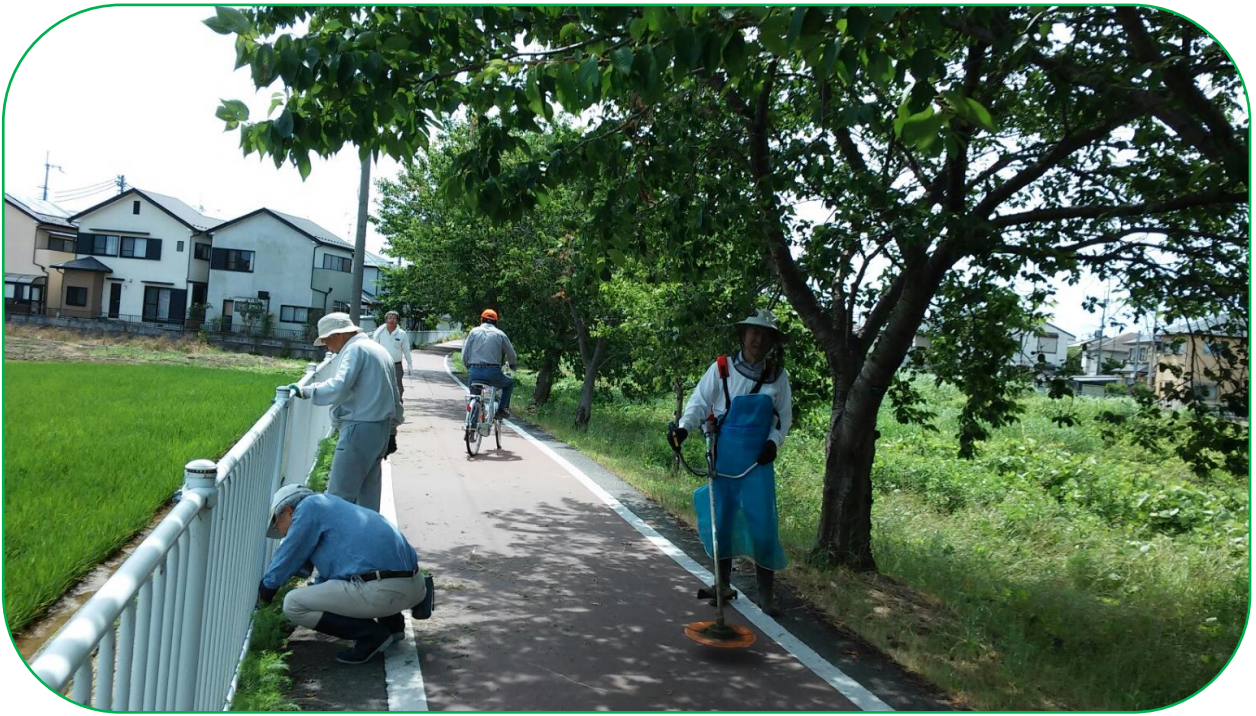
『はなの会』 第9回 地域活動 草刈&除草作業 平成29年6月26日

平成29年6月26日（月）午前9時より10時30分まで曇り空の作業日和に『はなの会』地域活動を実施しました。参加者は7名で白鳥川沿いのよし笛ロード長さ300mに渡ってコスモス・ひまわり周りの除草と土手の草刈を実施しました。