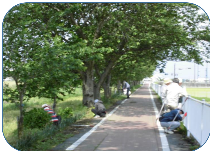
西洋スイセン周りの除草とよし笛ロードの柵沿いにコスモス・ひまわりの定植用の施肥