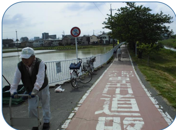
このよし笛ロードの長さ 300m に渡ってコスモス・ひまわりの定植の準備化学肥料の施肥