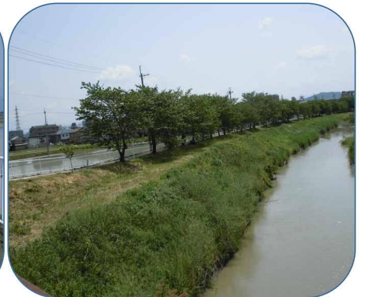
よし笛ロードの柵沿いにコスモス・ひまわりの定植の準備が完了しました。