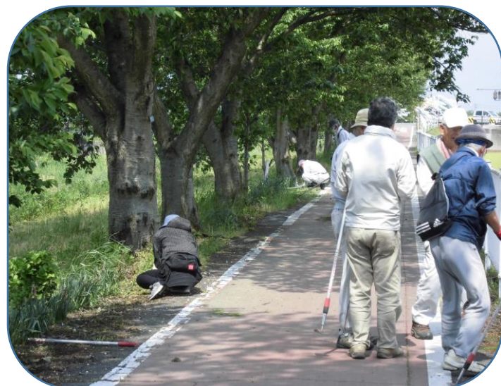
柵沿いにコスモス・ひまわりの定植準備の施肥