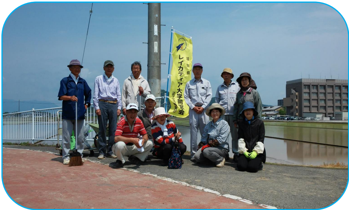
『はなの会』 第5回 地域活動に参加された方々 平成29年5月11日

平成29年5月11日（木）午前9時より10時45分まで好天気恵まれ初夏の心地良いそよ風を感じながら『はなの会』地域活動を実施しました。参加者は12名で白鳥川沿いのよし笛ロードの長さ300mに渡ってスイセン周りの除草と片側の柵沿いにひまわり・コスモスの定植用準備と施肥をしました。