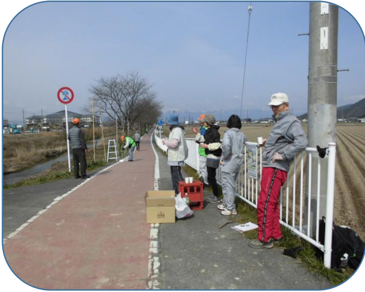
作業途中の休憩 お茶と菓子で一息