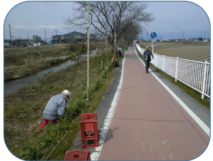
中日新聞社の取材活動