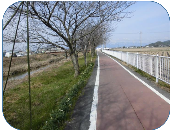
このよし笛ロードの両側長さ 300m に渡ってなはの植栽