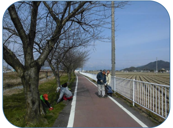
スイセンの根元周りの雑草除去作業と薬剤散布