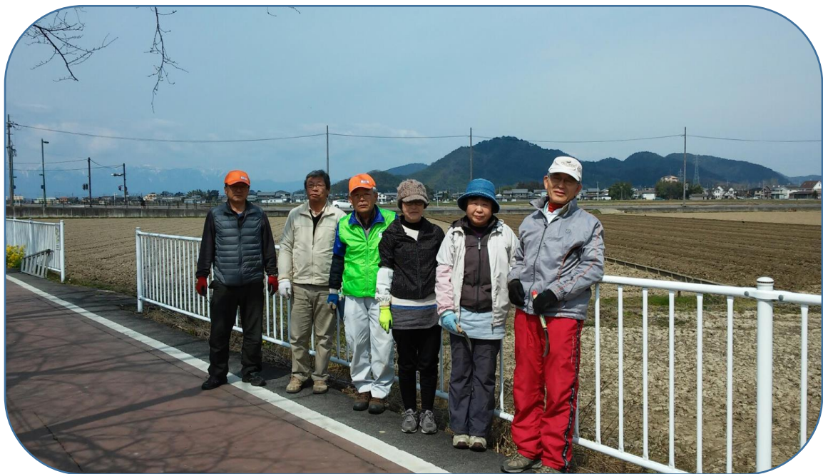
『はなの会』 第 2 回 活動に参加された方々 (他に 4 名参加)

平成 29 年 3 月 18 日（土）午前 9 時より 11 時 40 分まで第 2 回目の『はなの会』 地域活動を実施しました。参加者は 10 名で白鳥川沿いのよし笛ロードの長さ 300m に渡ってスイセンの根元の雑草除去とフェンス側に雑草除去用に薬剤を散布しまし た。（場所は地域活動のトップページの Google 図を参照下さい）