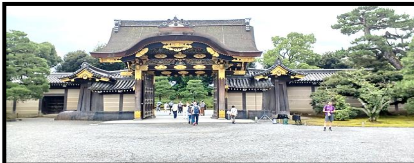
二条城 唐門(重要文化財) 奥に二の丸御殿(国宝)