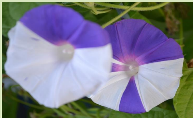
松島蜻蛉葉紫時雨絞咲分丸咲

朝顔は椿や皐月と同じく咲分けしやすい性質を持っています。これは染色体を出たり入ったりする「トランスポゾン(遊離遺伝子)」の仕業らしいのです。江戸時代の人たちは、メンデルの法則も知らないはずなのに、突然変異に着目し潜性遺伝子を引き出して、朝顔とは思えないものを生みだして来たのです。変化の箇所は「葉」の形・質・色、「花」の形・色・模様など15項目。それぞれパラメーターが