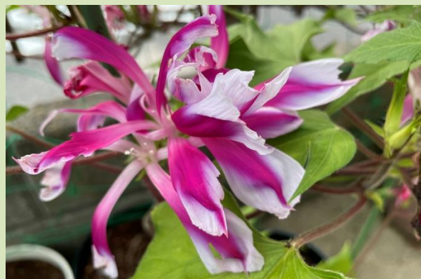
青蜻蛉丸笹葉赤紅覆輪切咲

色んな集団に参加するたびに「朝顔同好会」を作って楽しんでいます。「草津・栗東支部同窓会」でも同好会ができればと思っています。よろしくをお願いします。