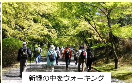
新緑の中をウォーキング