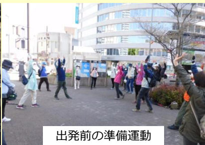
出発前の準備運動