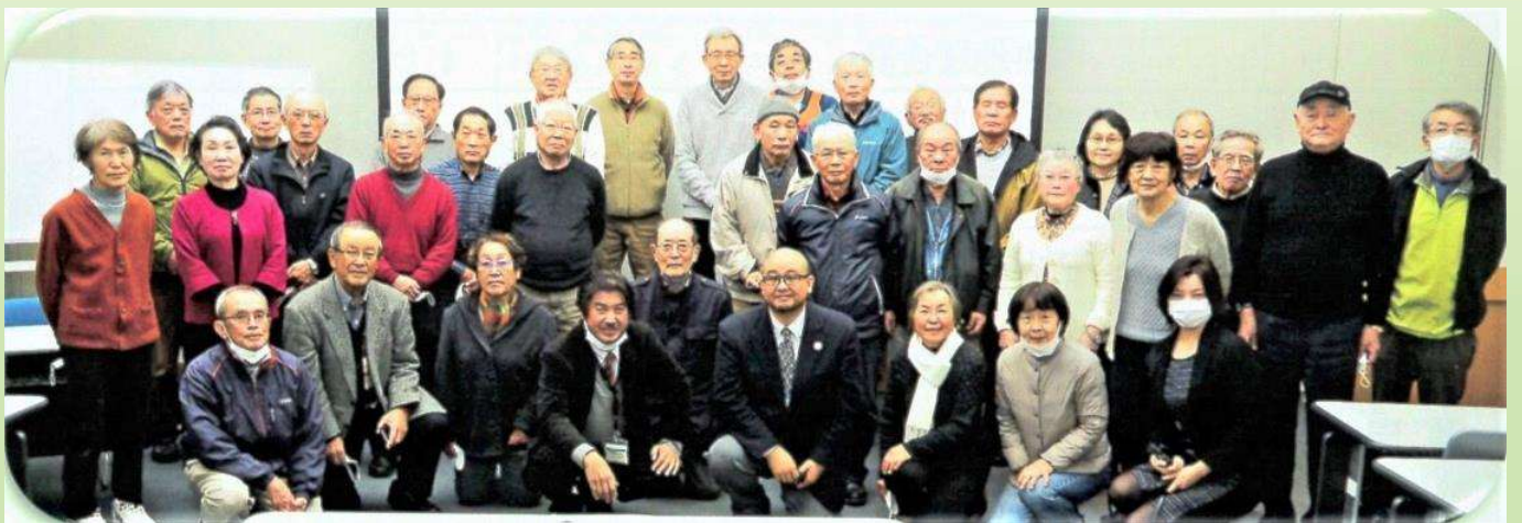
琵琶湖博物館での講義と見学会