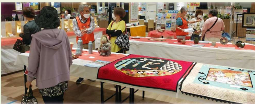
平和堂堅田店のイベント支援

5部会と各地域活動との連携を促す横串の役割。 外部団体との協働、行政とのつながり、活動の見える化、学生募集の支援、楽しく魅力ある活動を目指し