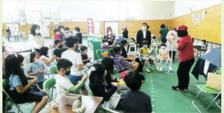
龍谷大学の「笑顔プロジェクト」