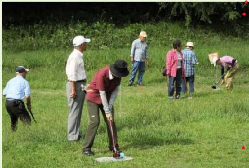
グランドゴルフ大会

スポーツによるコミュニケーションで健康と地域との活性化を図り会員の健康増進のためのスポーツに関する事業。グランドゴルフ、ウォーキング、ハイキングなどの実施。県、市の団体などが開催するスポーツ行事への参加もしています。