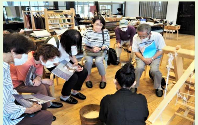
伝統工芸施設の見学会