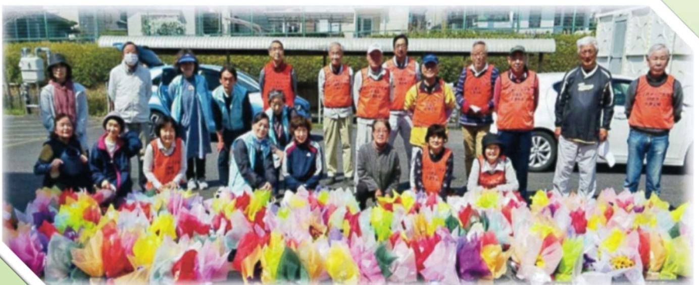
小学校への花鉢提供