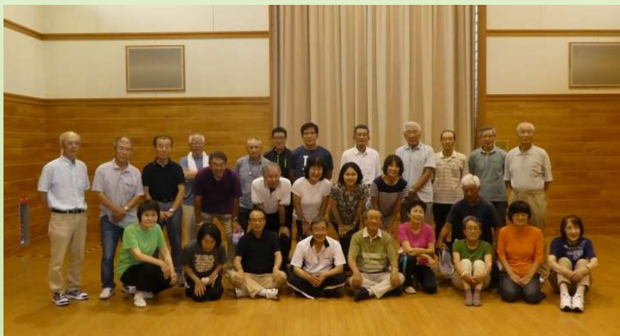
室内スポーツ大会