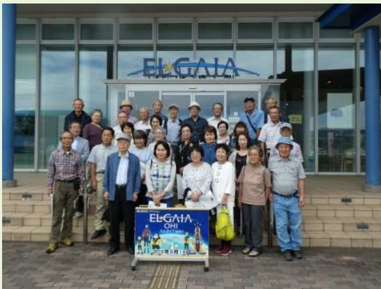
関西電力ELGAIAの見学会