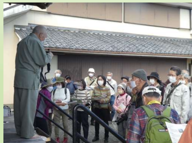
研修部会と共同ハイキング