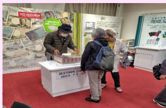
【1億円の重さ体験コーナー】