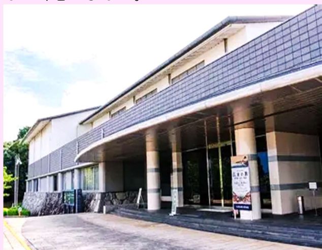
【大津市歴史博物館】

募集人数を超える応募がありました。今後も大津の歴史、暮らし、文化などに触れた企画を検討したいと思います。