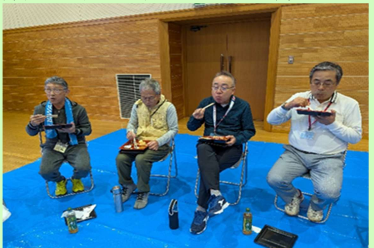
少し豪華なお弁当いただいています

興味ある参加しやすいイベントを企画していくことはもちろんですが、仲間の絆、輪を広げて実りある楽しい人生を過ごしていきたいものですね。