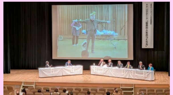
三日月知事とのパネルトーク