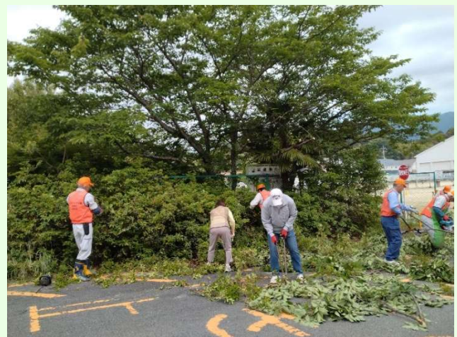
和邇小学校 (2025. 5. 27)