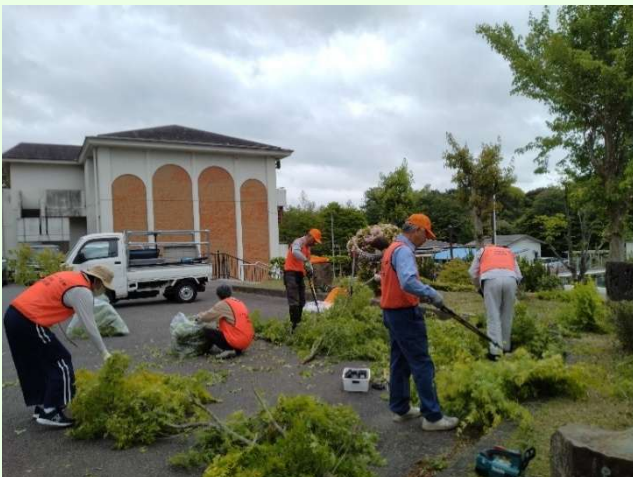
雄琴小学校 (2025. 5. 9)