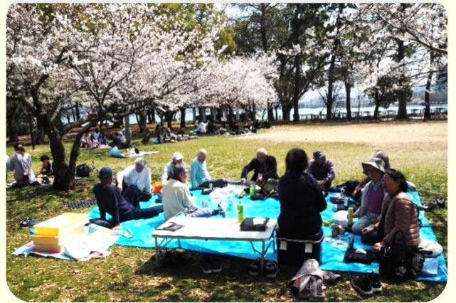
膳所城跡公園で花見の宴