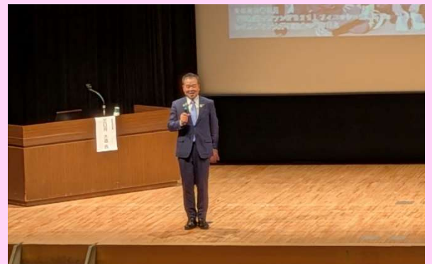
三日月知事による講義