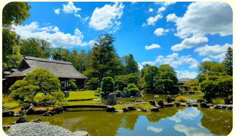
3月31日予定の桂離宮参観