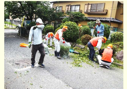
小学校校庭剪定作業