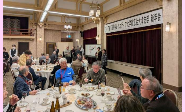
2026年レイカ大津新年会