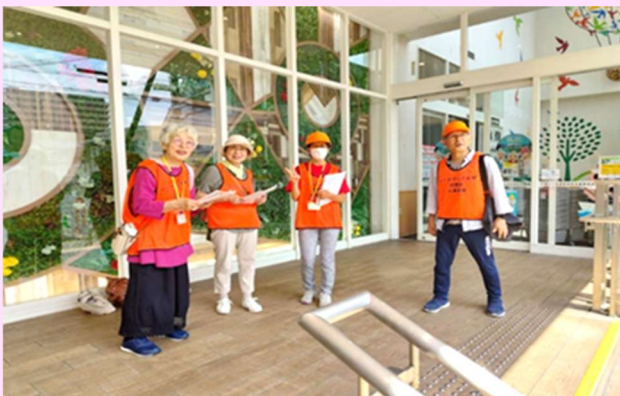
◇平和堂石山店学生募集活動

*10月の新入会員歓迎会はレイカディア大学体育館にて「モルック競技会」を歓迎ミーティングを予定している。