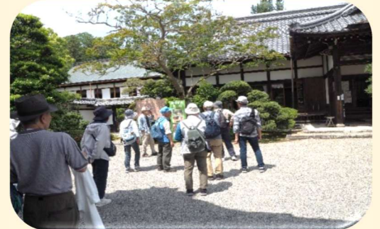
坂本界わいハイキング