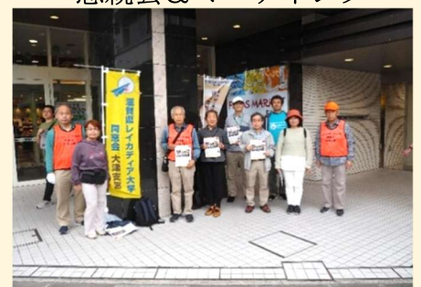
47期生学生募集チラシ配布