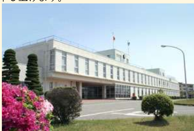
【国立印刷局 彦根工場】

募集案内が出来上がりましたら、同窓会会員の皆様に告知致します。是非ともご参加お願い申し上げます。