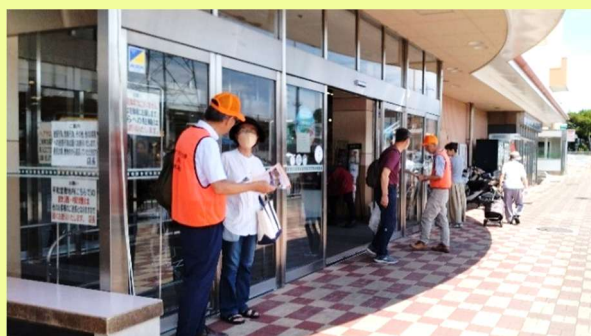
レイカディア大学生募集チラシ配布（平和堂坂本）