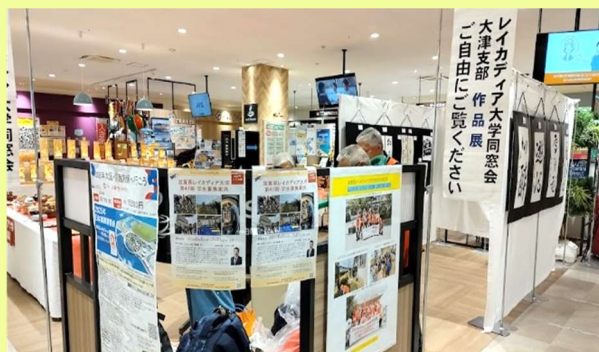
平和堂石山 作品展示会