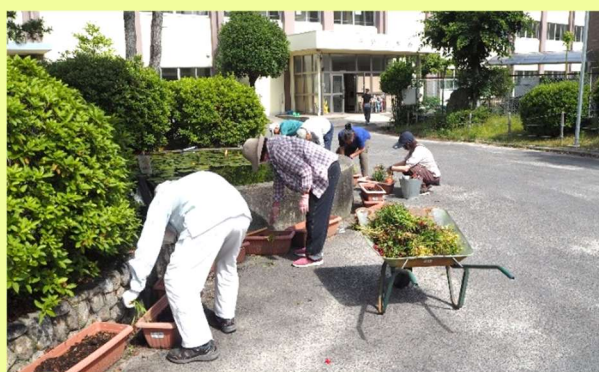
平野小学校花壇整備