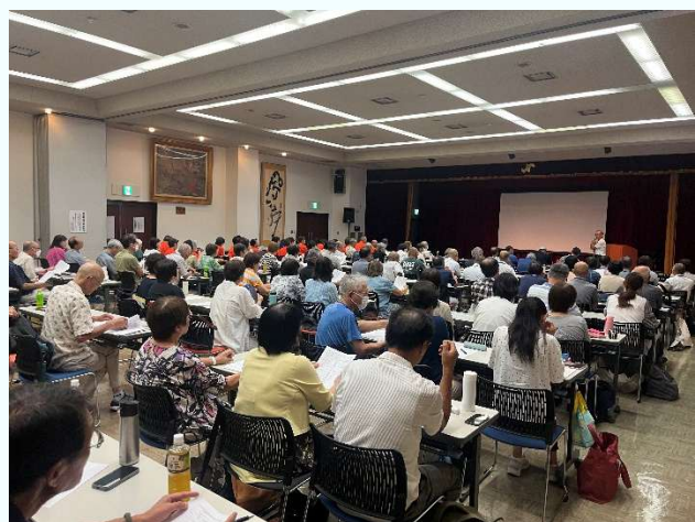
（彦根キャンパス）※写真は会場の彦根商工会議所