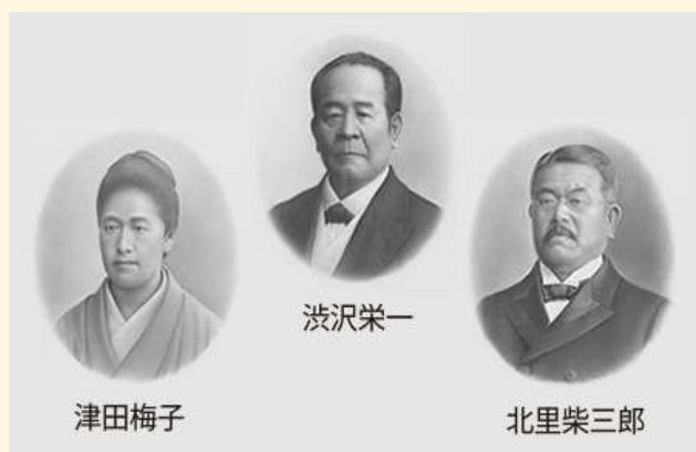
【新紙幣の人たちの肖像】