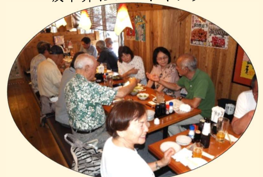
懇親会&ミーティング