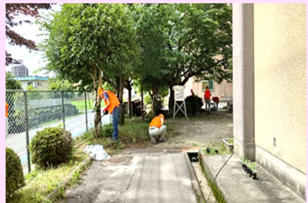
◇南郷小学校校庭美化活動