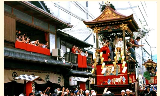
大津祭り 10月11日宵山 12日本祭