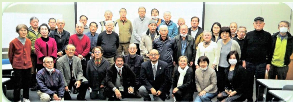
琵琶湖博物館での講義と見学会