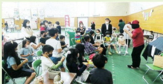
龍谷大学の「笑顔プロジェクト」