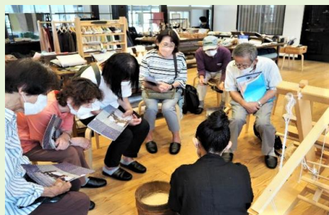
伝統工芸施設の見学会