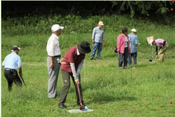
グランドゴルフ大会

スポーツによるコミュニケーションで健康と地域との活性化を図り会員の健康増進のためのスポーツに関する事業。グランドゴルフ、ウォーキング、ハイキングなどの実施。県、市の団体などが開催するスポーツ行事への参加もしています。