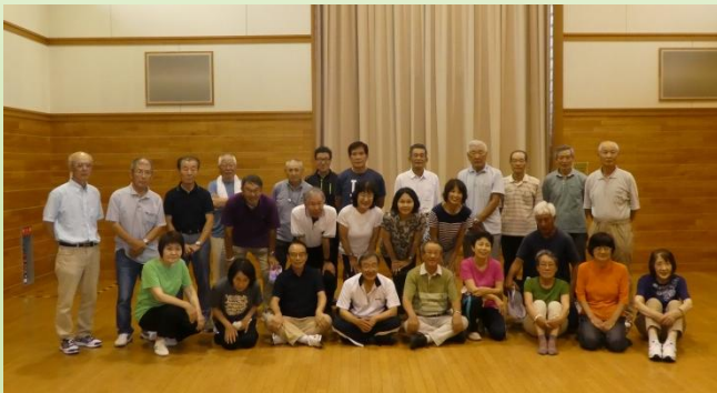
室内スポーツ大会