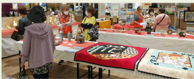
平和堂堅田店のイベント支援

5部会と各地域活動との連携を促す横串の役割。 外部団体との協働、行政とのつながり、活動の見える化、学生募集の支援、楽しく魅力ある活動を目指し