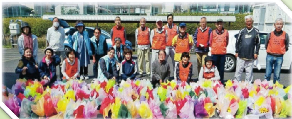
小学校への花鉢提供