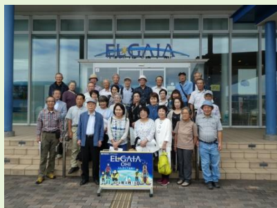
関西電力ELGAIAの見学会