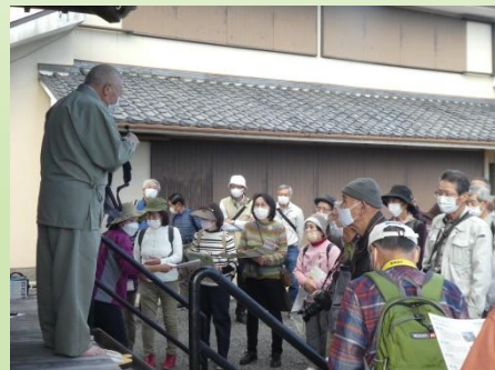
研修部会と共同ハイキング