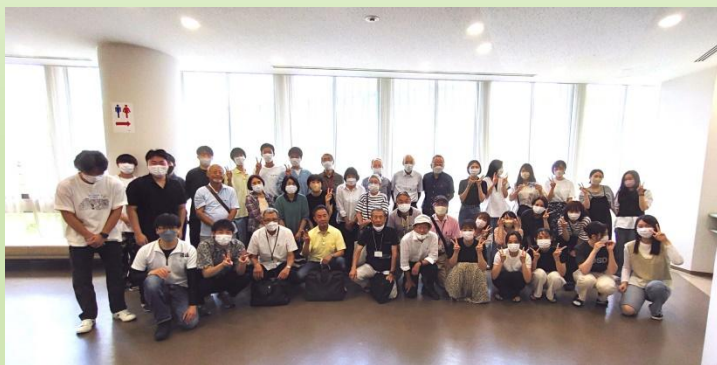
皇子山での大津っ子祭り