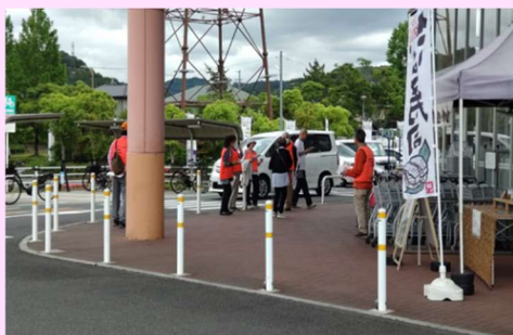
◇2025.5.31 FM 青山 GH 学生募集