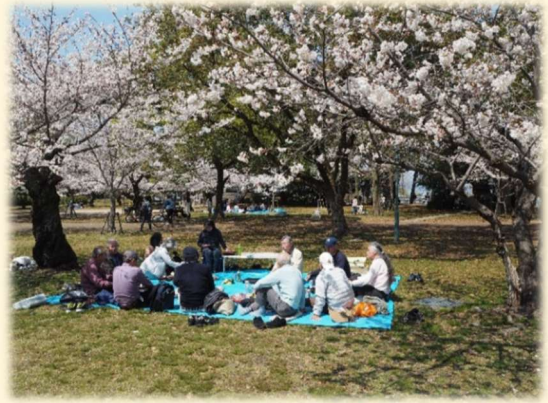
(さくら満開の下で)