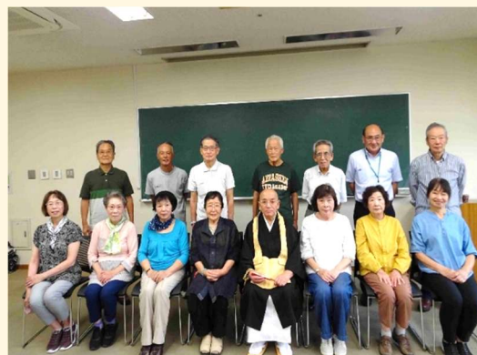
【写経後の集合写真】