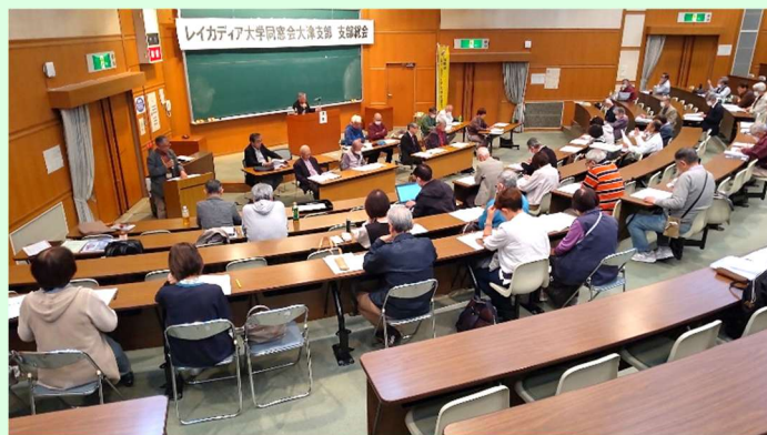
レイカディア同窓会大津支部総会(4月17日)