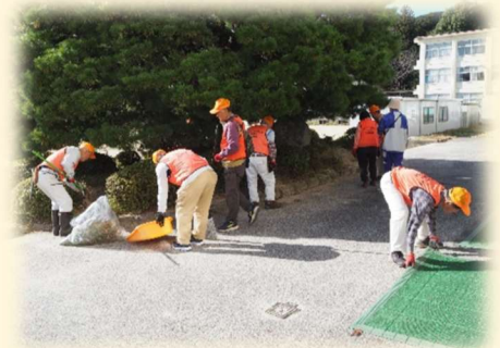
(小学校校庭剪定作業)