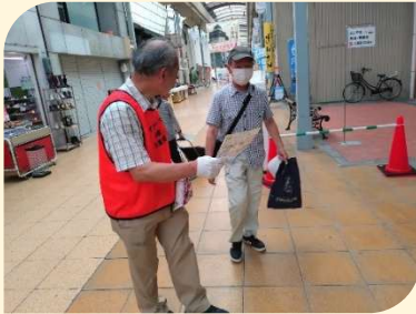
レイカディア大学 46 期生学生募集チラシ配布