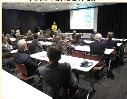
【防災に関する講義】