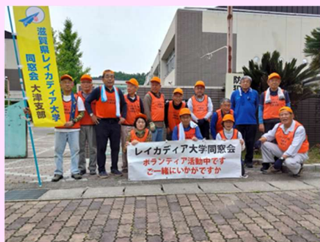
◇2025/5/29 青山小学校校庭美化活

また、特に本年度としては、昨年同様、より多くの会員が参加していただくための施策が必要と思料しています。そのためには、まずは会員相互の参加への「お声かけ」が大事ではないかと、参加者の同卒期への「いっしょに参加しよう。楽しかったよ」の輪を広げていきたい。そのためには地域で行った活動、行事内容を即座に会員全員へ参加者が誰であったか、参加しての感想も含めた配信を実施し、啓蒙活動の一端としたい。また、支部長提案の、知名度向上委員会の中での入会年度のフレッシュな会員で組織される「改善チーム」が考える、新しい参加者を増やしていく視点での組織や運営の見直し等の提案にも大いに期待し、また一緒に議論していきたい。