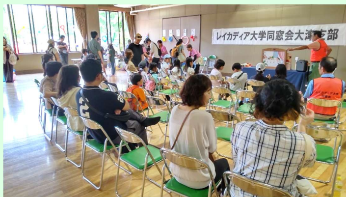
第41回大津っ子まつりに参加(5月18日)