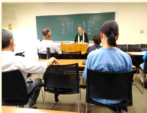
【写経の講義を拝聴】

昨年度は9月30日（月）レイカディア大学草津キャンパス第2研修室で15名の参加のもと「写経の体験教室」を行いました。猛暑の厳しさが残るなかでしたが参加者一同、黙々と「般若心経」を書写され充実した時間を持てたと思います。また、年明けの3月6日（木）滋賀県危機管理センター、NHK 大津放送局への施設見学会を実施しました。募集人員25名のところ35名の参加の大盛況で訪問先のご理解を得て無事に催行できました。防災意識向上、アナウンサー、気象予報士体験など納得と楽しい体験を感じられたと思います。ご参加下さいました皆様「ありがとうございました。」