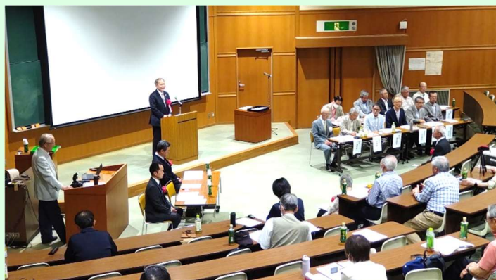
レイカディア同窓会本部総会(5月21日)