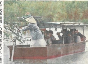
ヨシが群生する水路で、よし笛を演奏するサークルのメンバーたち—近江八幡市円山町で

県レイカティア大学米原校の卒業生がつくるサークル「よし笛アンサンブルマレイカ」の有志が八日、近江八幡市の西の湖一帯で、和船に乗りながら、西の湖のヨシで作ったよし笛を演奏した。