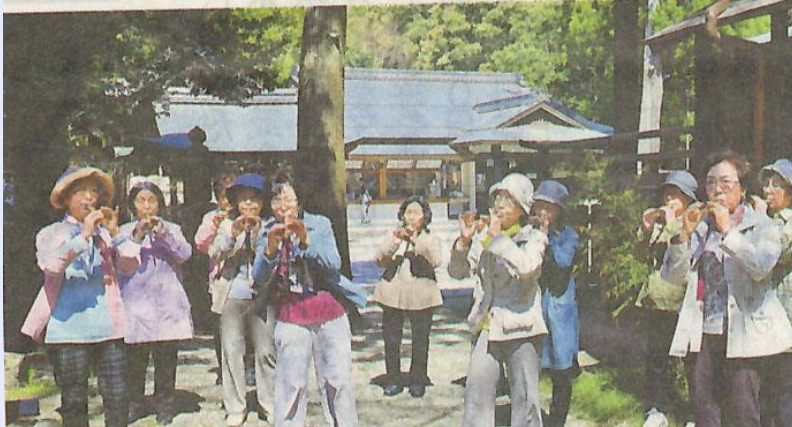
よし笛の演奏を披露するメンバーたち (近江八幡市宮内町・日牟禮八幡宮)