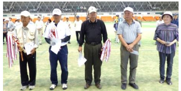
左から優勝、準優勝、3位、4位、5位入賞者

日頃鍛えた技を生かし競い合う中にも笑いもあり楽しいひと時を過ごすことが出来ました。参加者は61名、ホールインワ賞は8名でした。