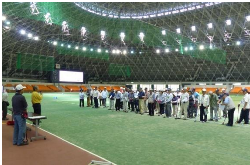
開会式にて支部長挨拶

日頃鍛えた技を生かし競い合う中にも笑いもあり楽しいひと時を過ごすことが出来ました。参加者は61名、ホールインワ賞は8名でした。