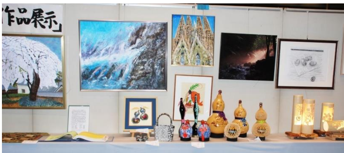
昨年の大学祭の様子 (卒業生の作品展示)

今年も、大学祭が七月二十五日(水)から二十七日(金)まで米原校で開催されます。スローガンは「楽しく・仲良く・元気よく」です。地区幹事様より配布お願いした、卒業生の作品展示コーナーが設けられて展示されます。またこの機会に在校生や地域の方々、先輩とのふれあい交流を深め、さらには、これらが学生募集のための一助になればと期待しています。友人、ご近所お誘いあわせの上見学してください。在校生がお待ちしています。