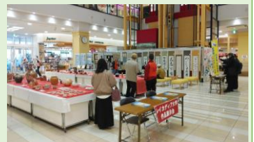
大津支部作品展の様子

今年度、新たな試みとして45期生の学生募集の時期に合わせ、中部支部会員の皆さんの作品展を開催することになりました。それぞれの皆様の趣味や活動の発表の機会になればと考えています。つきましては、事前に内容や出展数の把握をさせていただきたいと思っておりますので別紙報告書にて 4月20日 までに 川嶋までお届けください。ぜひとも ふるって、ご出展くださいますようお願いいたします。