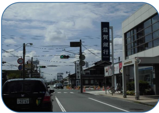
江頭西交差点 滋賀銀行江頭支店を右折 野洲方面から来ると左折