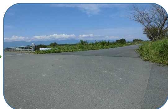
右折後直進、日野川堤防を右折 堤防の左側に河川敷グランド