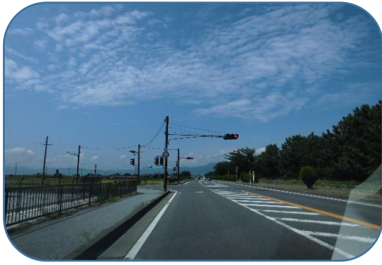
水茎岡山城跡を通りすぎ、 左側の揚水機場を超えてすぐ信号を左折