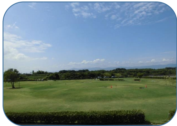
日野川堤防の右側に河川敷グラウンド