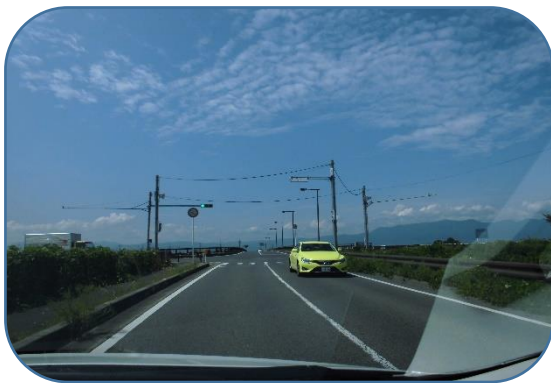
477 号野村橋を左折、堤防沿い道路を進む