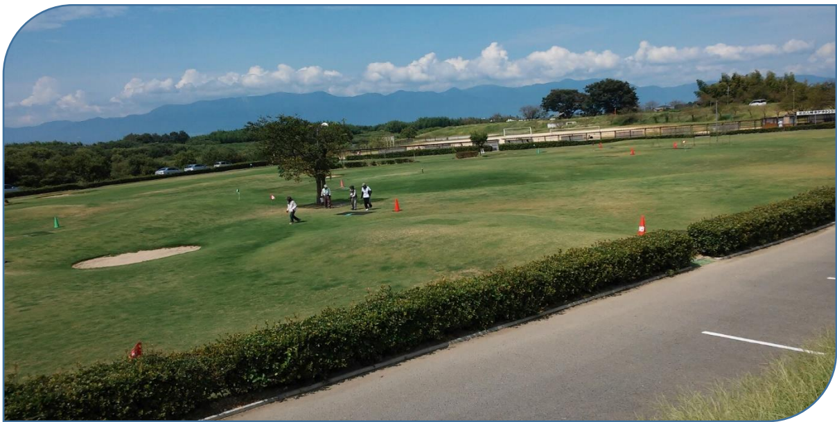
日野川河川敷グラウンドゴルフ場