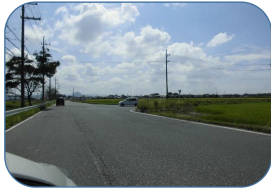
左折後三叉路交差点を右折