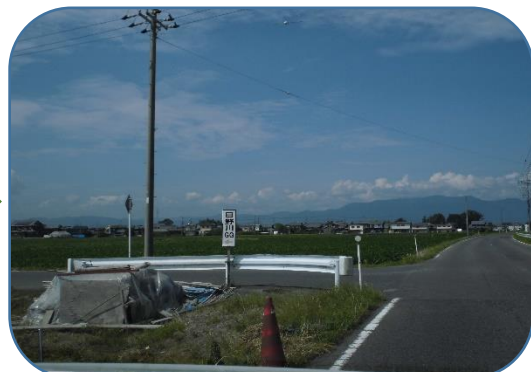
滋賀銀から約 2km,左に JA 倉庫を過ぎると 左に日野川GGの標識、この交差点を左折