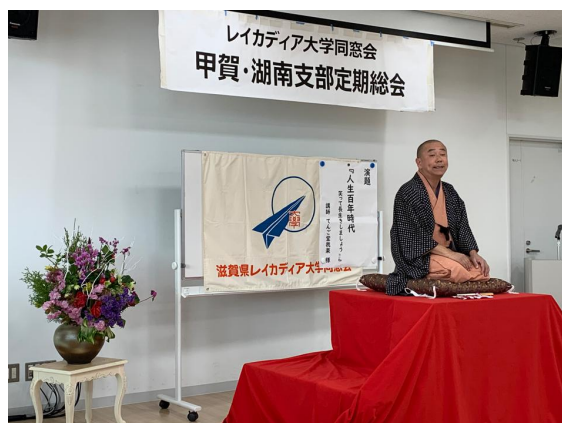
総会第2部の我楽師による講演