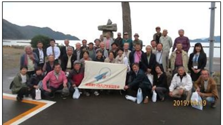
千鳥苑で食事後またパチリ