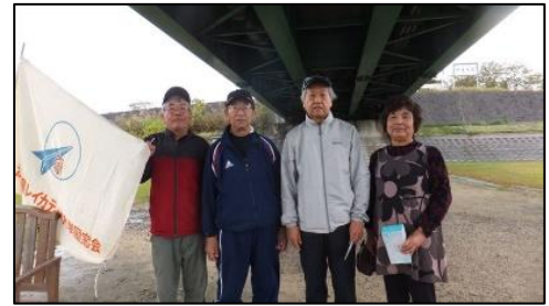
左から支部長、優勝、準優勝、3位