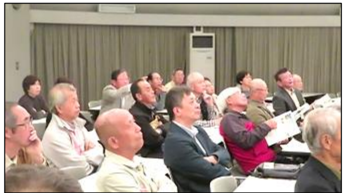
発電所PRセンターでの説明を真剣に聞いています