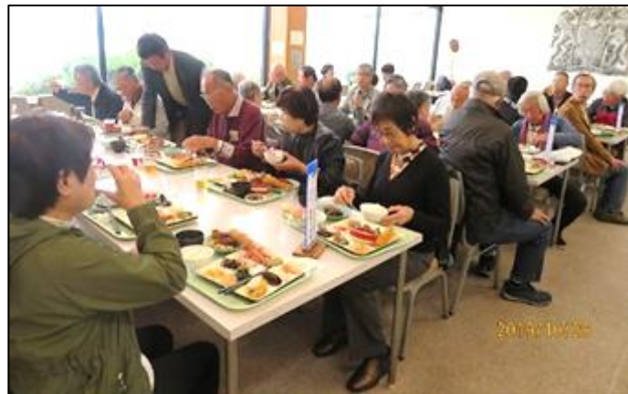
海鮮バイキングを美味しくいただきました