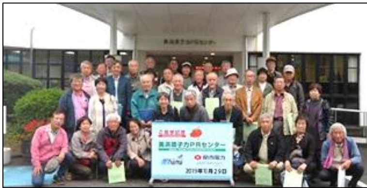
美浜原子力発電所PRセンター前で集合写真