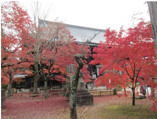
真如堂(真正極楽寺)の紅葉