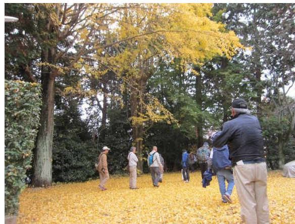
吉田山のイチョウと「紅もゆる丘の花」記念碑前