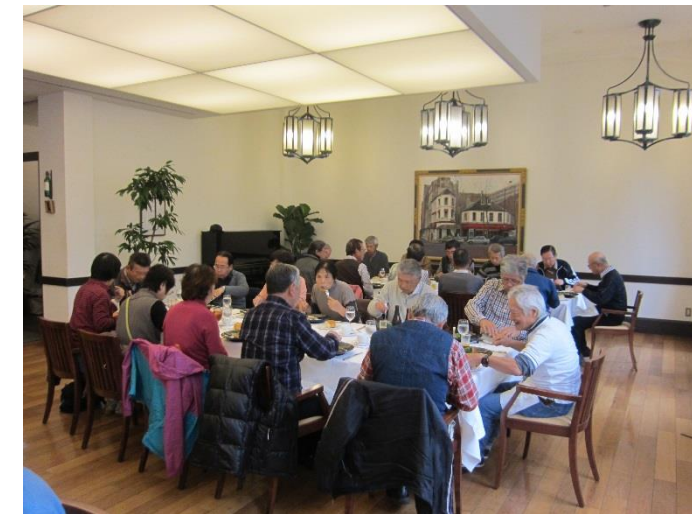
京都大学内 レストラン ラ・トゥール