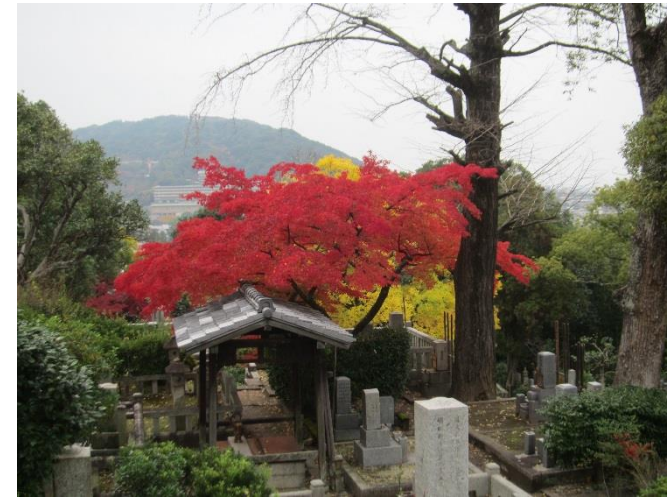
金戒光明寺の文殊塔前の紅葉