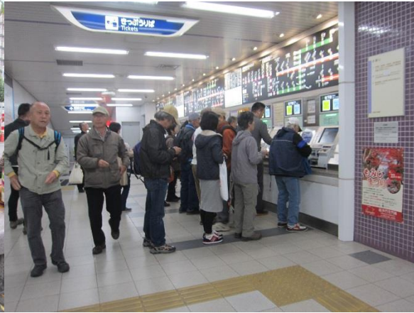
地下鉄・山科駅改札口