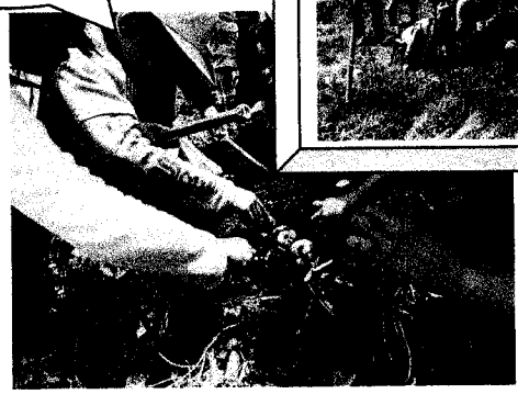
竹間伐・散策路整備

子どもたちが自然体験しながら、樹木・生態系などを学ぶ環境学習林もめざしています。