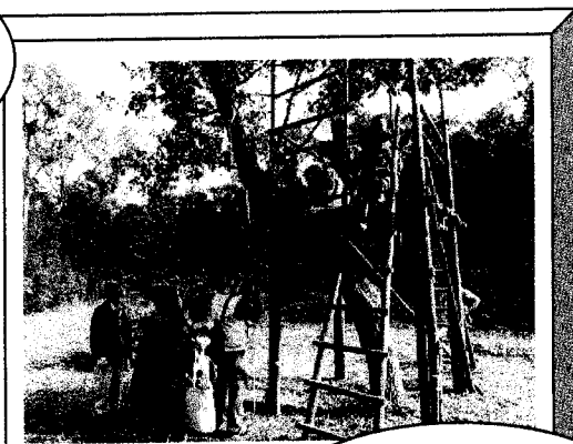
自然の森観察会 自然と遊ぼう