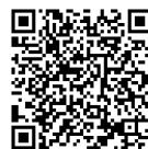
びわ湖マラソン 支部HP