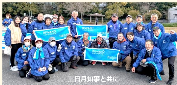
三日月知事と共に

活動参加者からは「来年も参加します」「完走者の笑顔に感動した」など感想もいただきました。ボランティア活動に参加いただいた会員の皆様には、長時間にわたって活動していただきありがとうございました。