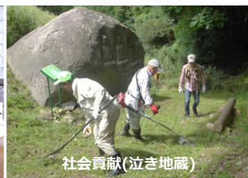
社会貢献(泣き地蔵)