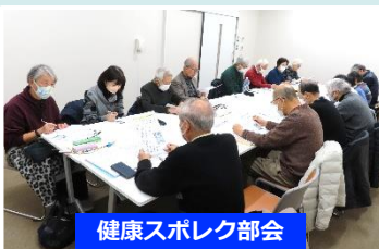
健康スポレク部会