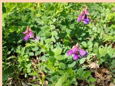
<ハマエンドウ開花>

地味な活動ですが、5月にハマエンドウ、7月にハマゴウの花が咲くと何故か嬉しいものです。興味がありましたらご一報ください。