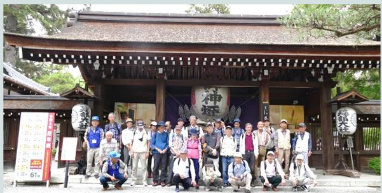
第16回歴史探訪会にて