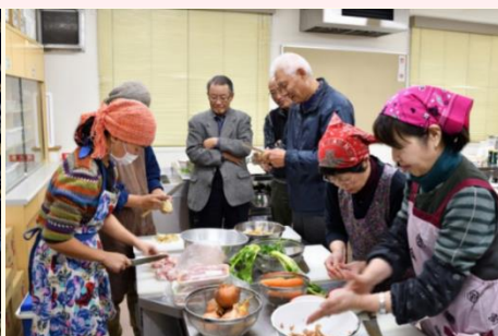
ボリビアの美味しい家庭料理体験