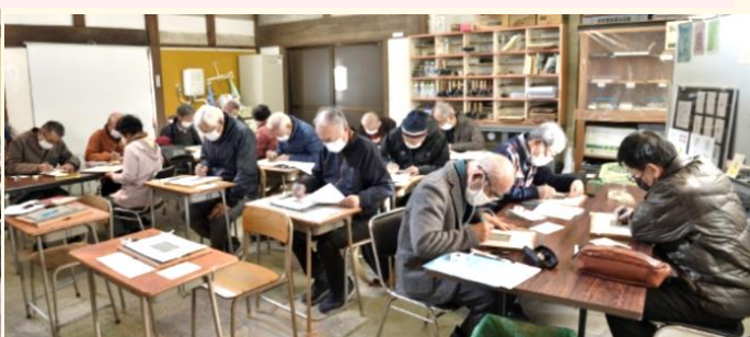
昔に返ってガリ版創作体験