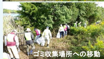
ゴミ収集場所への移動