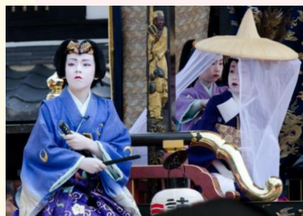
栈敷席から長浜こども歌舞伎見学