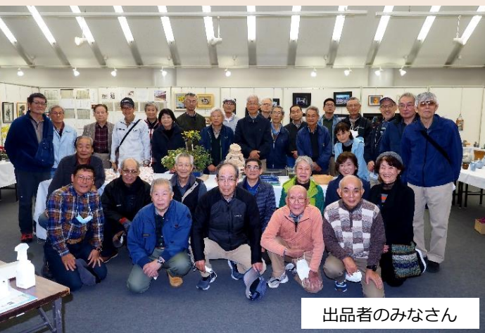
出品者のみなさん