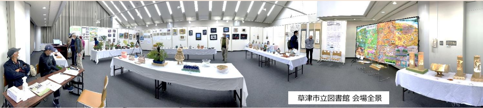
草津市立図書館 会場全景