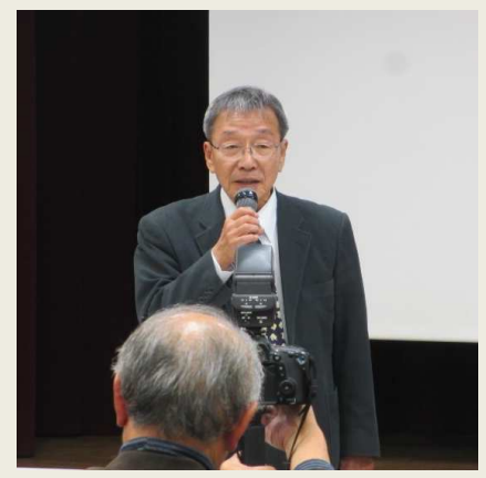
奥田地域活動部会長の閉会挨拶