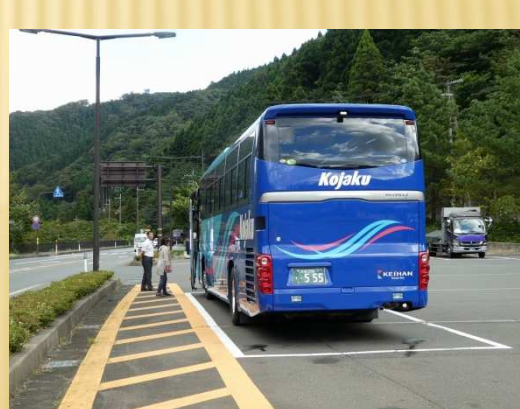
鯖街道 宿場町跡「熊川宿」をウォーキング