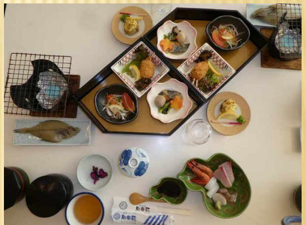
楽しい昼食でした 於) 小浜フィッシャーマンズ・ワーフ