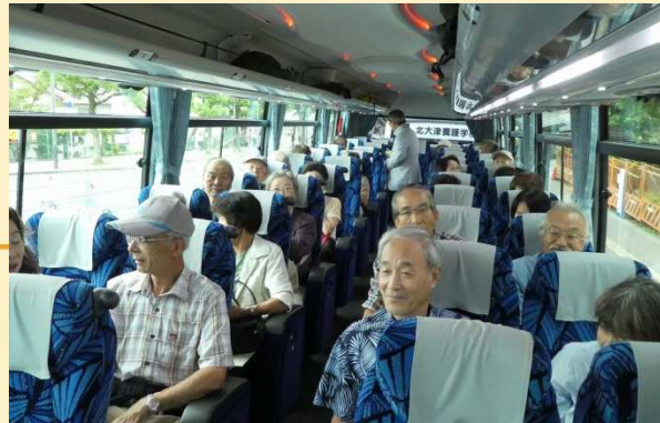
大津駅前から関電調達のバスで出発