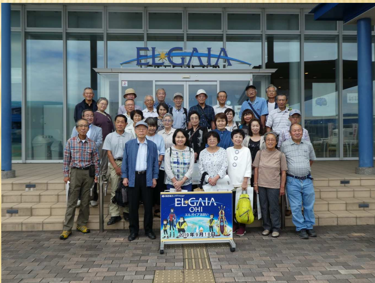
全員「エルガイアおおい」の玄関 発電所見学前

帰路瓜割の滝、熊川宿を散策、途中の道の駅でおみやげを買って全員元気でバスツアーを終えることが出来た。