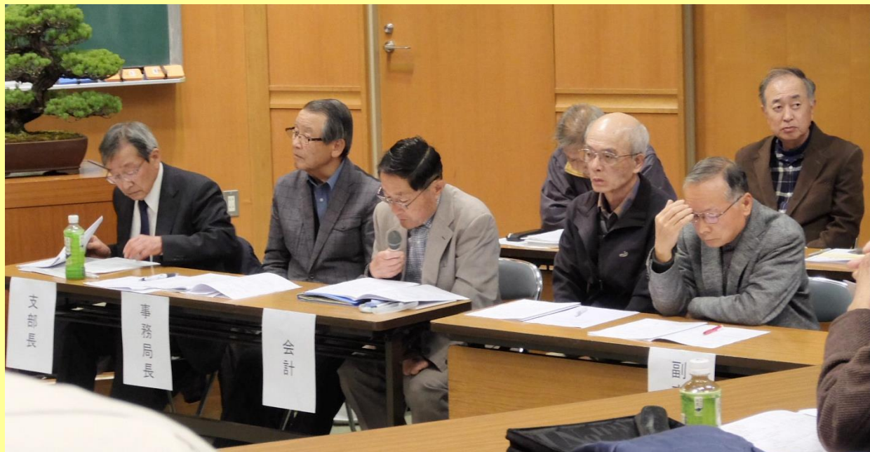
収支決算の説明と審議、監査報告、採決の光景