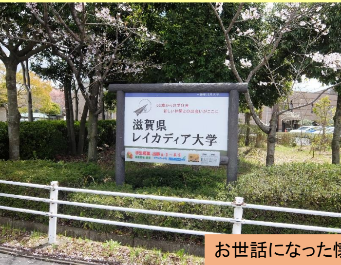
お世話になった懐かしいレイ大構内