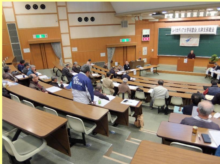
議案審議の光景(説明、質疑応答、採決)