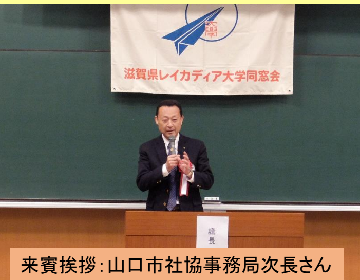
来賓挨拶: 山口市社協事務局次長さん