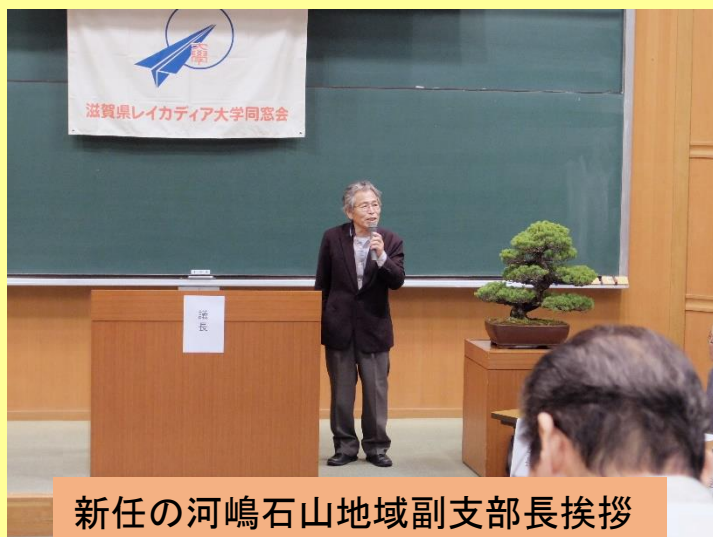
新任の河嶋石山地域副支部長挨拶