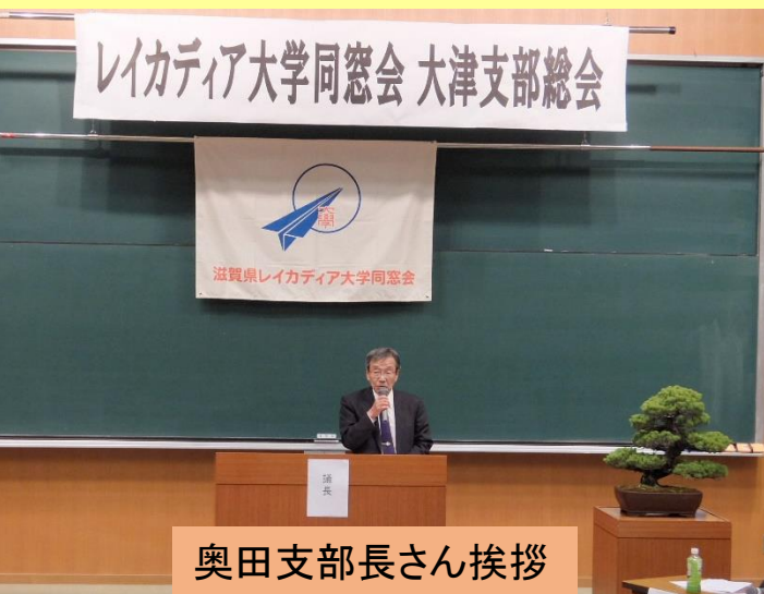
奥田支部長さん挨拶