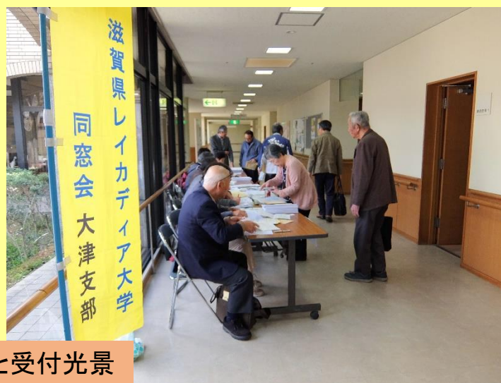
議案書と受付光景